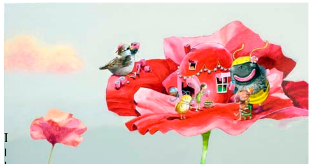
Illustratie: Mark Janssen